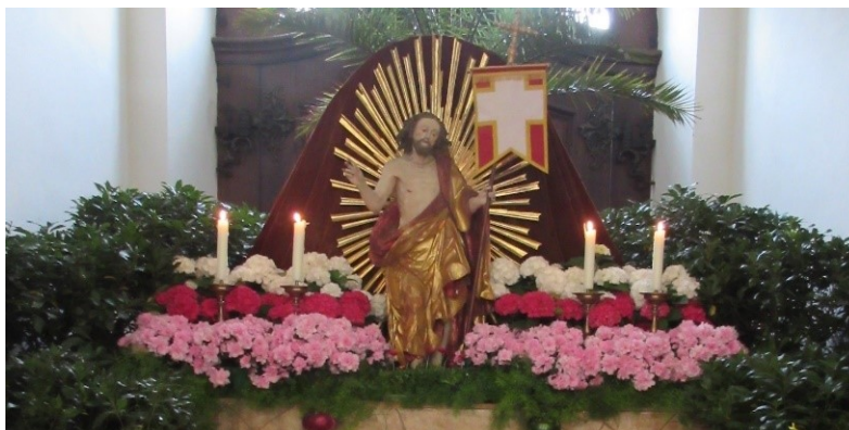
Hl. Grab Kloster Schäftlarn

Internet: www.erzbistum-muenchen.de/pv-schaeftlarn