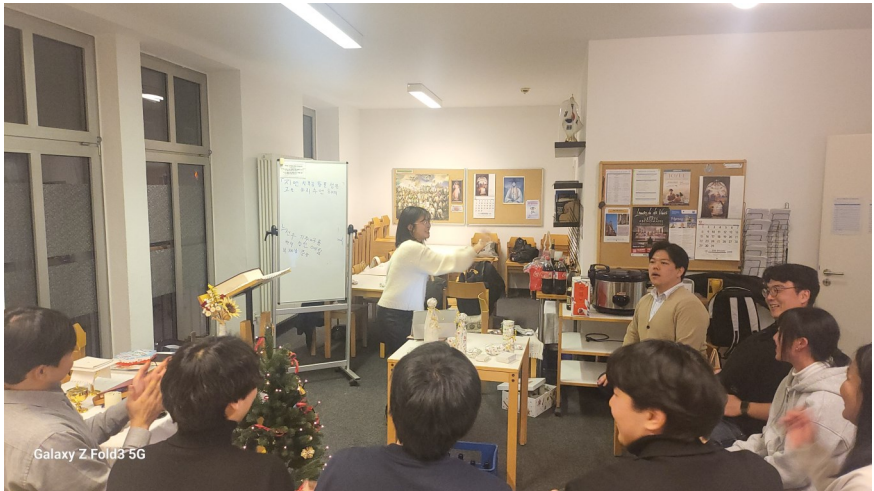
12월 25일 성탄미사 후 뒷풀이