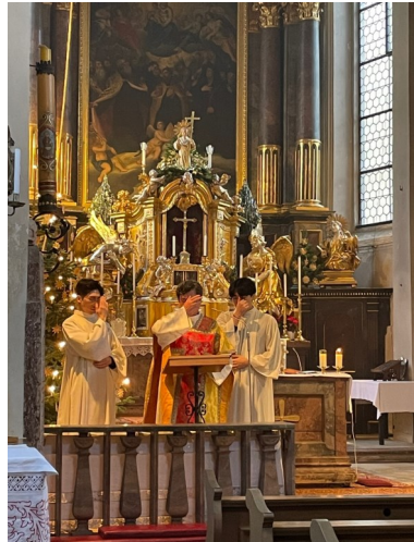
12월 25일 성탄미사 2

Der Tod ist gewiss, die Stunde ungewiss. ■■■