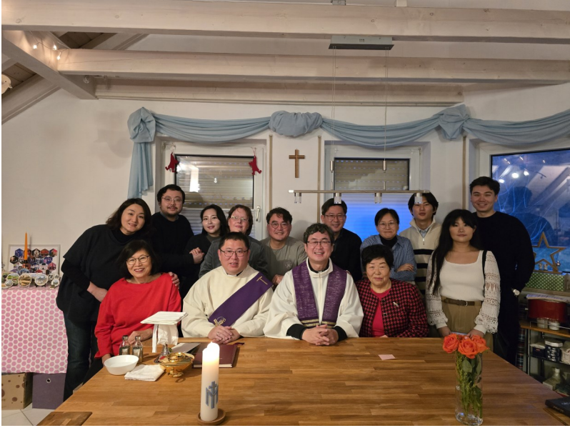
12월 21일 뷔르츠부르크 공동체 가정미사