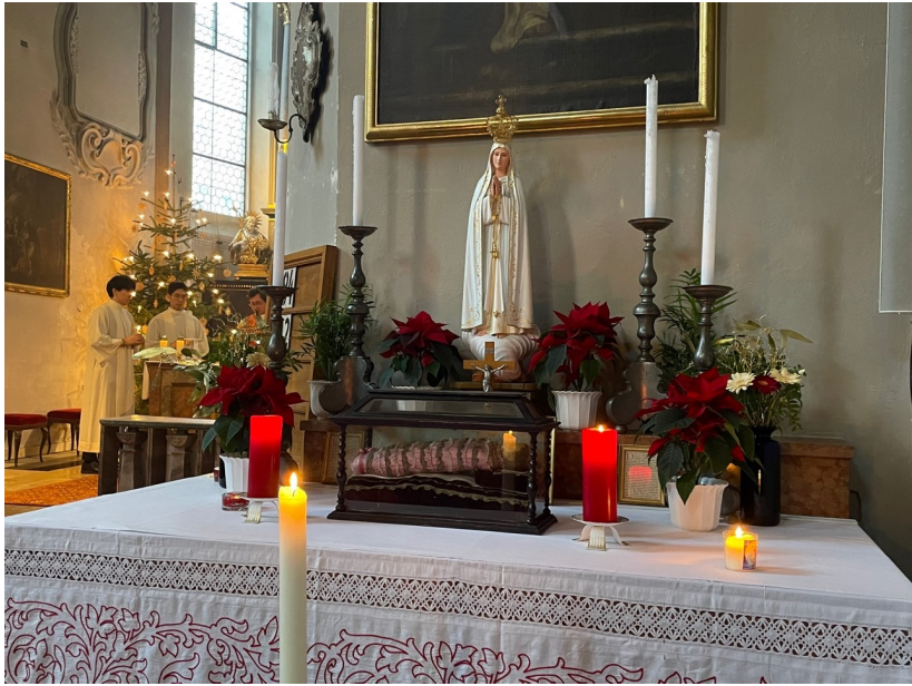
12월 25일 성탄미사 3