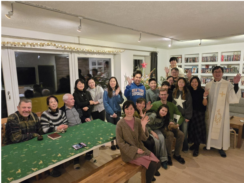
12월 27일 레겐스부르크 공동체 성탄송년미사