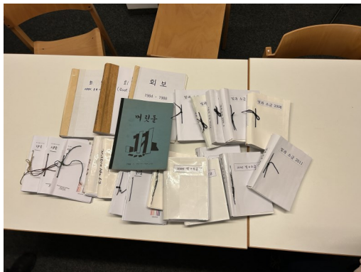
빛과 소금 월보 모음