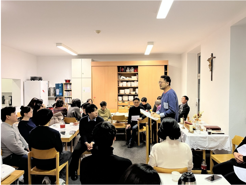
12월 15일 본당 총회

거룩하신 아버지, 전능하시고 영원하신 주 하나님, 언제나 어디서나 아버지께 감사함이 참으로 마땅하고 옳은 일이며 저희 도리요 구원의 길이입니다. 아버지께서는 오늘 그리스도를 통하여 저희 구원의 신비를 밝혀 주시고 그분을 인류의 빛으로 드러내 주셨나이다. 또한 그리스도를 죽음의 운명을 지닌 인간으로 나타나게 하시어 그분께서 지니신 불사불멸의 힘으로 저희에게 새 생명을 주셨나이다. 그러므로 천사와 대천사와 좌품 우품 천사와 하늘의 모든 군대와 함께 저희도 주님의 영광을 찬미하며 끝없이 노래하나이다.