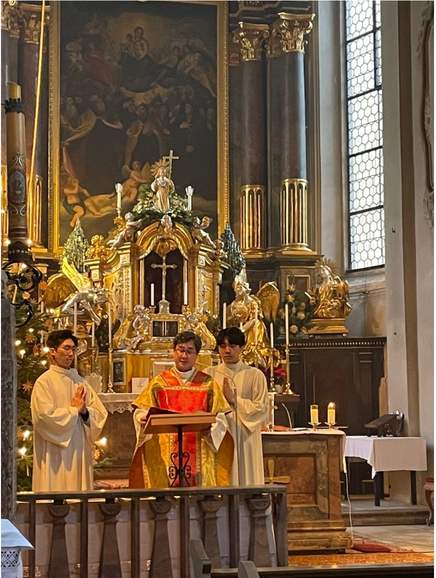
12월 25일 성탄 미사 1