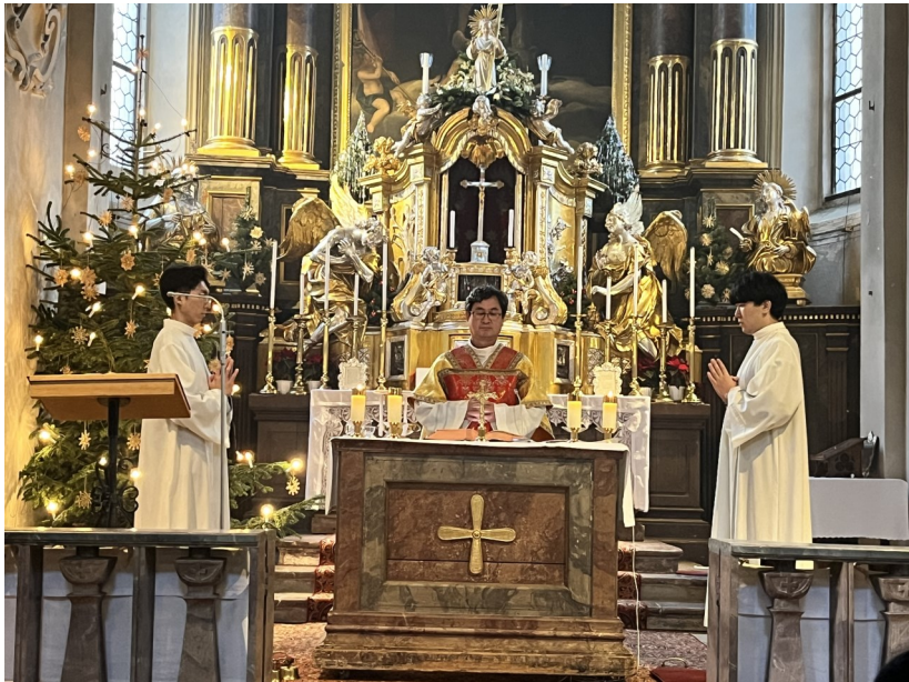
12월 25일 성탄미사 4