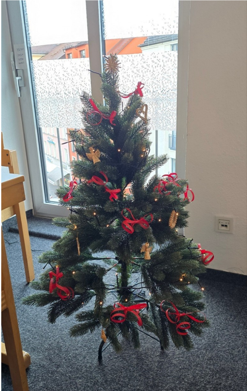
12월 20일 성모회 크리스마스트리 제작