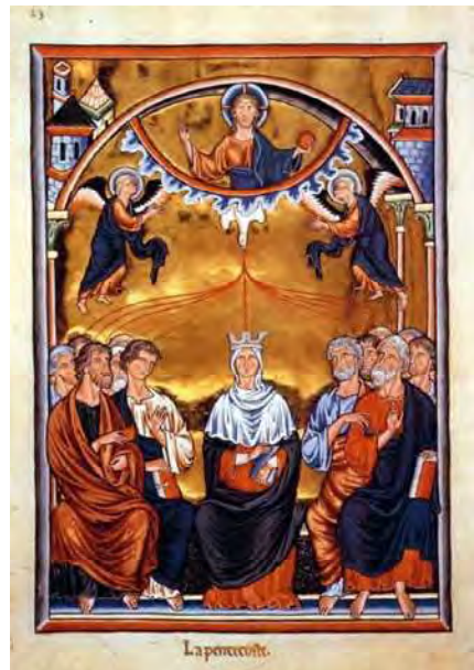
Ausgießung des Heiligen Geistes, Illumination aus dem Ingeborg-Psalter (um 1200)

Neben den vier christlichen Tugenden gibt es die 7 Gaben des Heiligen Geistes: Weisheit, Einsicht, Rat, Stärke, Erkenntnis, Gottesfurcht und Frömmigkeit (vgl. Jes 11,1-3). Dabei handelt es sich um von Gott geschenkte bzw. vermittelte Fähigkeiten. Unter diesen Gaben steht der „Rat“ der Klugheit am nächsten. Beide ermöglichen es, unter herausfordernden (Lebens-) Konstellationen gute Entscheidungen zu treffen. Doch während Klugheit sich stärker auf das eigene Wohl richtet, zielt die Gabe des Rates auf Entscheidungen auch im Sinne Gottes und des Nächsten. Thomas von Aquin bringt dies prägnant auf den Punkt: „Die Gabe des Rates befähigt den Menschen, un-