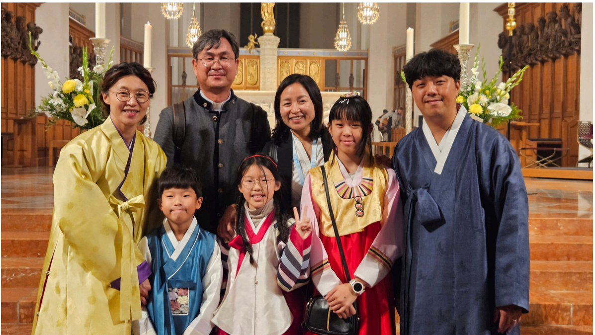
9월 28일 외국인 공동체 미사 3