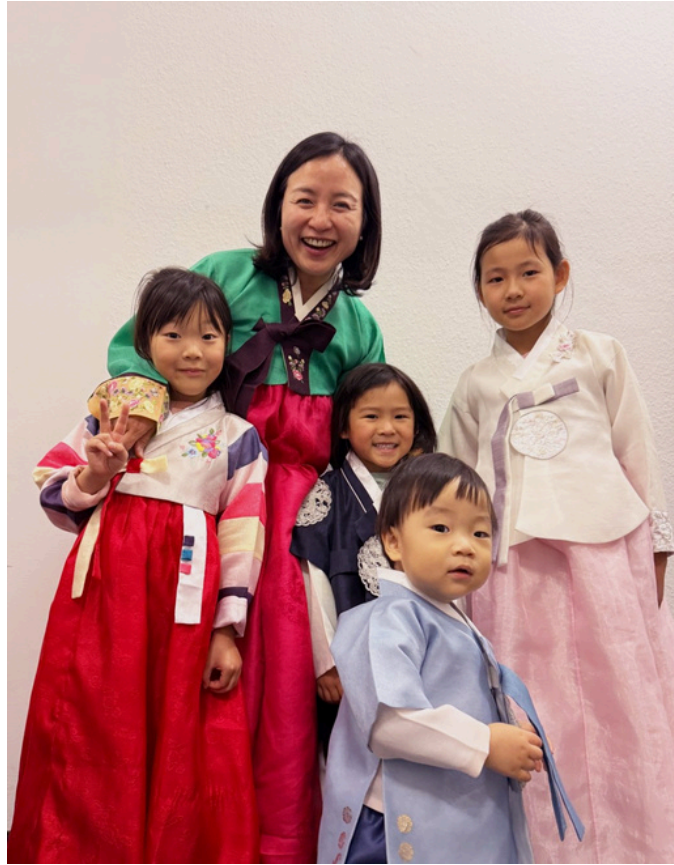
10월 5일 추석미사 한복팀