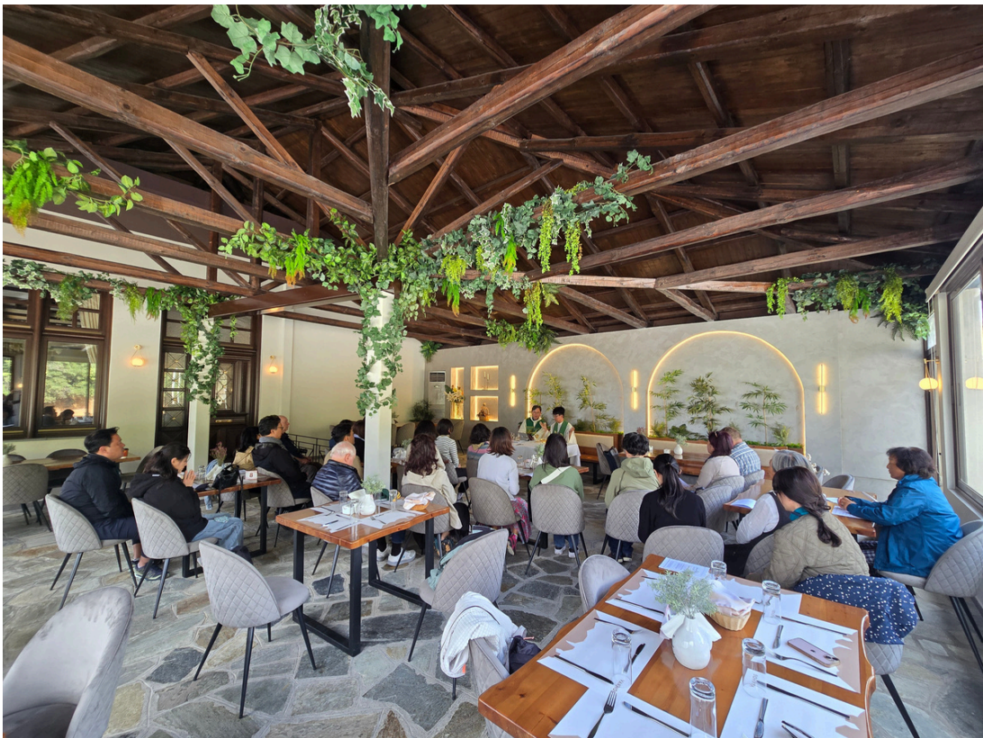
2025년 성 아우구스티노 성서모임 성지순례 메테오라 식당 미사 2