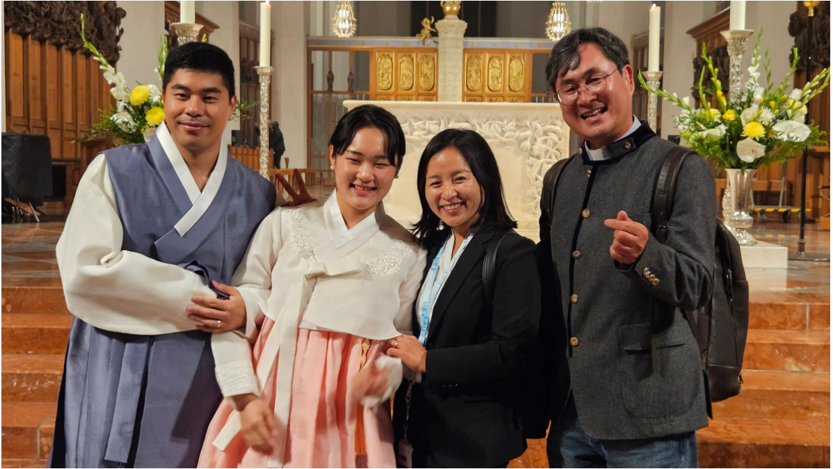
9월 28일 외국인 공동체 미사 2