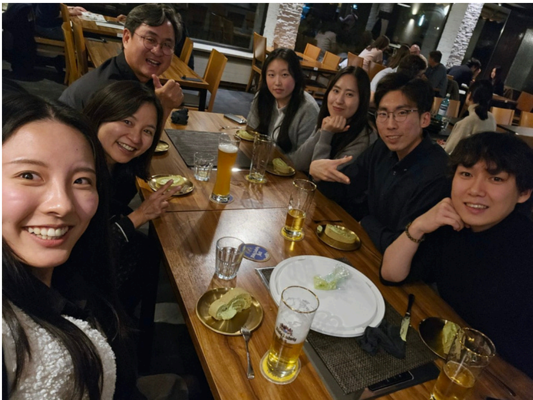
2025년 전례부 회식