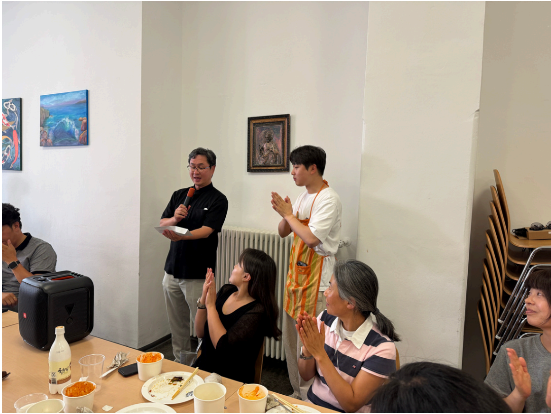
7월 13일 청년 성서연수 기금 마련 바자회 1