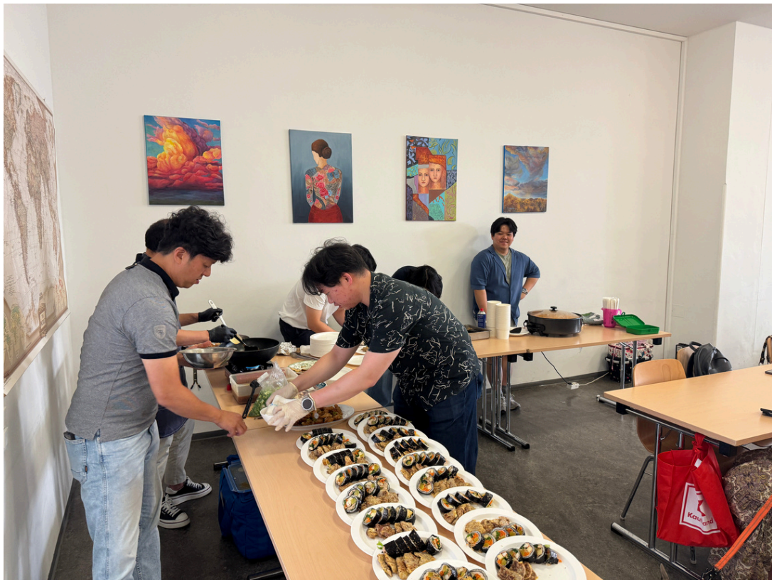
7월 13일 청년 성서연수 기금 마련 바자회 2