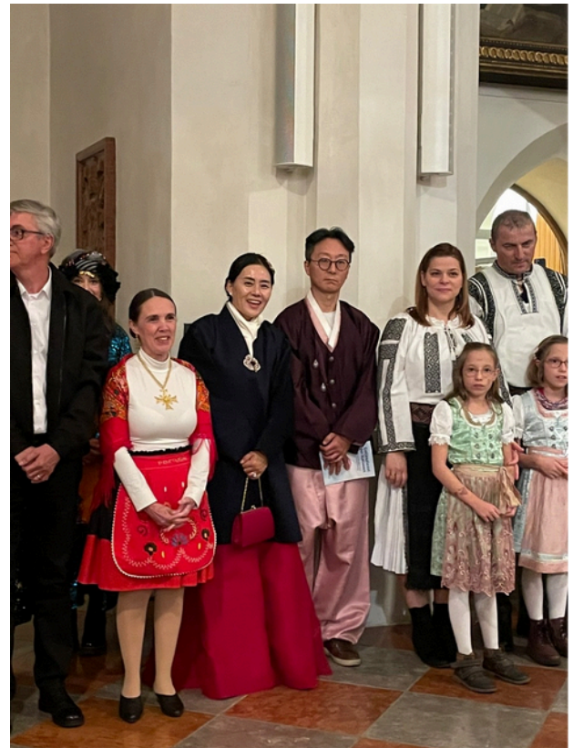
9월 28일 외국인 공동체 미사 1

“사랑은 참고 기다립니다. 사랑은 친절 합니다. 사랑은 시기하지 않고 뽀내지 않으며 교만하지 않습니다.. 나에게 사랑이 없으면 나는 아무것도 아닙니 다.”(1코린 13, 2.4.)