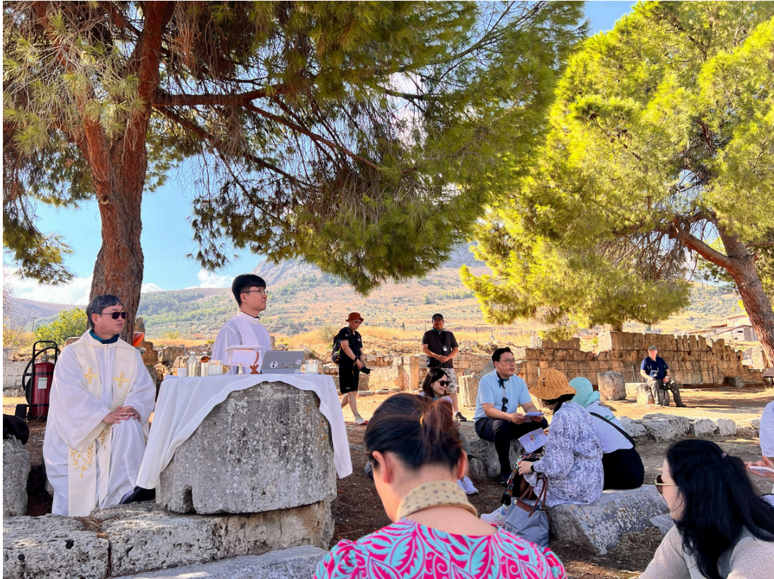
2025년 성 아우구스티노 성서모임 성지순례 코린토 미사