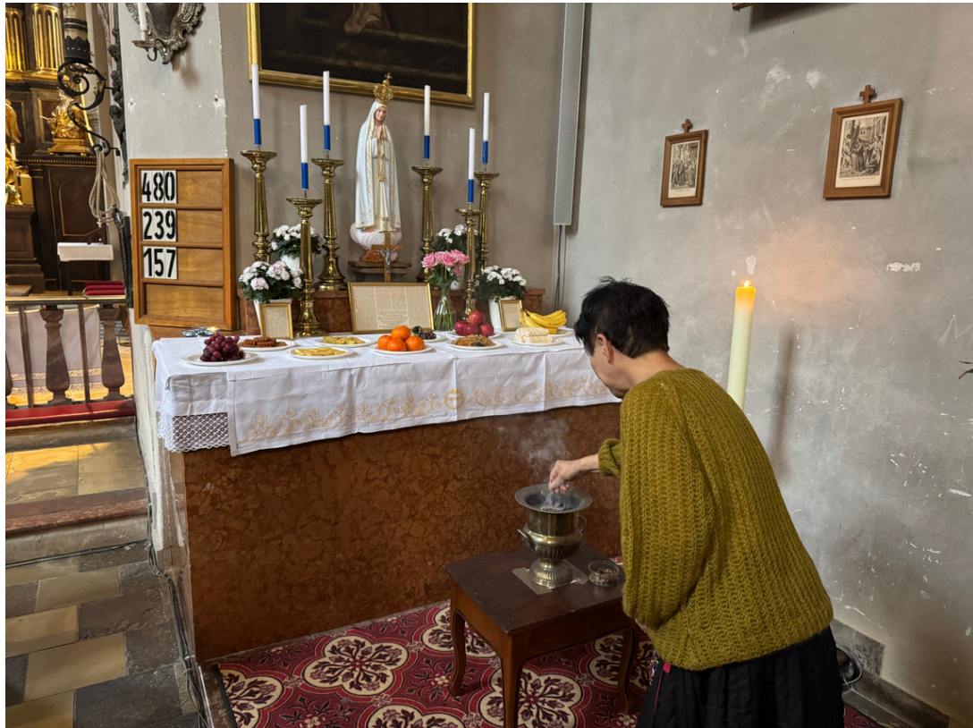
10월 5일 추석미사