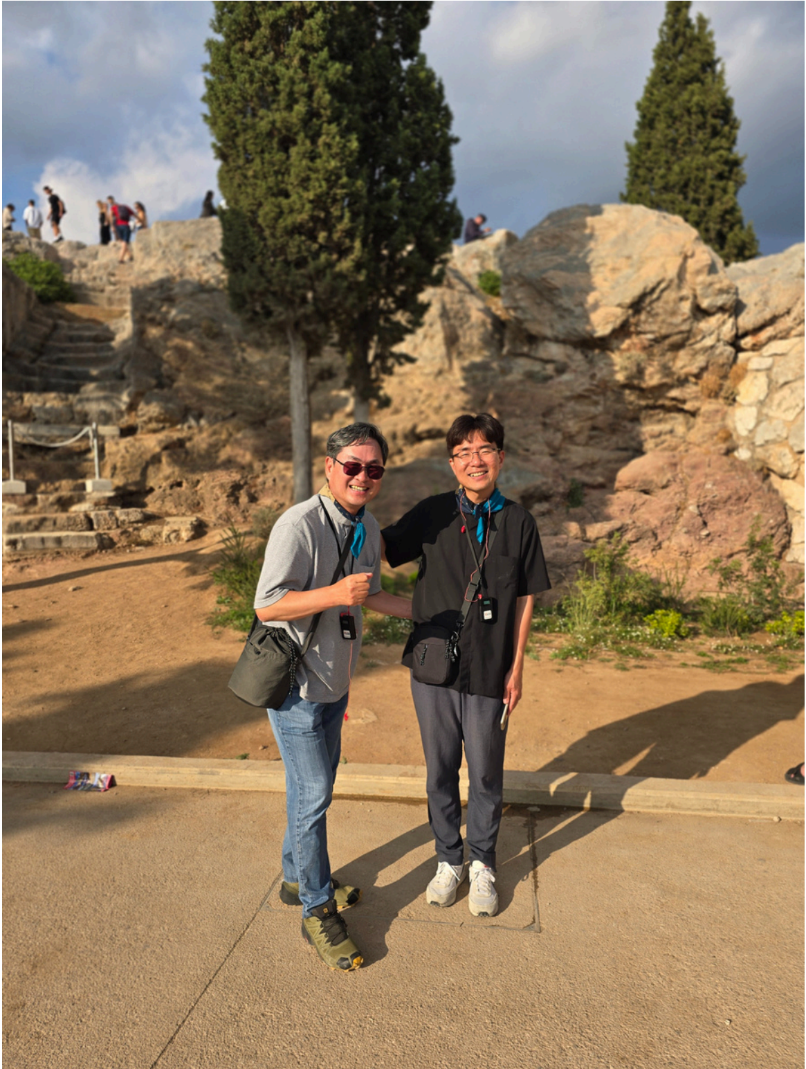
2025년 성 아우구스티노 성서모임 성지순례 아테네 아레아 파고