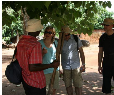
Fahrtstrecke Mkata - Dar es Salaam: 200 km / ca. 4 Std. Übernachtung mit VP im Stadthotel: Mediterraneo Hotel

Von Mkata aus geht die Reise zurück nach Dar es Salaam. Die pulsierende Hafenstadt bildet den passenden Abschluss der Tansania-Rundreise. Hier, am Indischen Ozean, bietet sich noch einmal die Gelegenheit, die besondere Atmosphäre der Küste zu genießen – das Rauschen der Wellen, die frische Meeresbrise und das geschäftige Treiben der Stadt. Die letzte Nacht am Meer lädt dazu ein, die vielen Eindrücke der vergangenen Tage in Ruhe nachklingen zu lassen, bevor am nächsten Tag die Heimreise nach Deutschland ansteht.