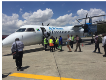
Flughafentransfer 45 km / ca. 15 Std.

Bushkomba sagt: Asante sana na karibuni tena Tansania.