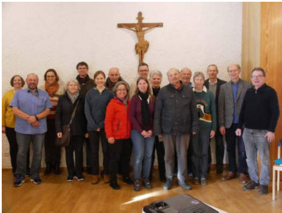
Bild: Lektoreneinkehrtag 2024

Quellen: www.erzbistum-muenchen.de unter dem Stichwort ‚Liturgische Dienste/Lektor*in‘, bibel einfach lesen: Hilfe für Lektorinnen und Lektoren, Kooperation zwischen Katholische Bibelwerk e.V. und Bonifatiuswerk der deutschen Katholiken e.V. 2025.