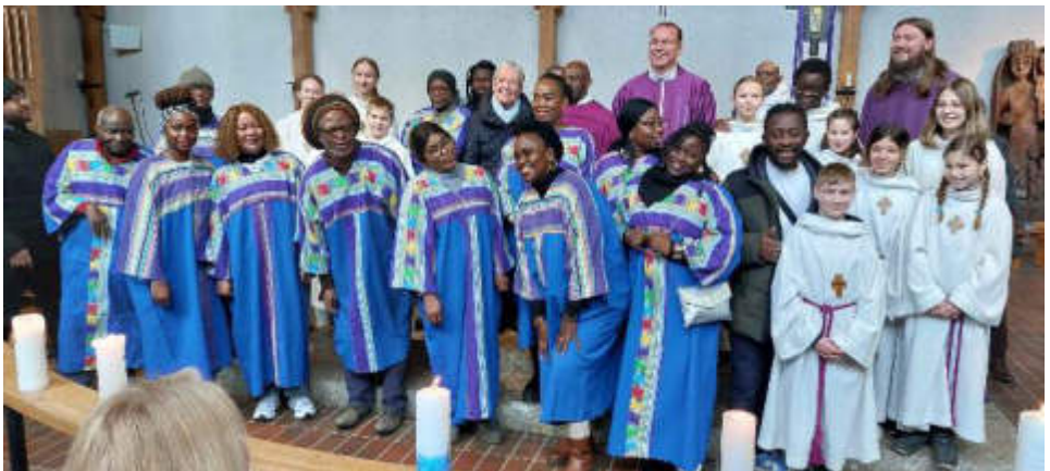
Bild: Gruppenfoto nach dem Gottesdienst zum 20-jährigen Jubiläum des Schulprojekts