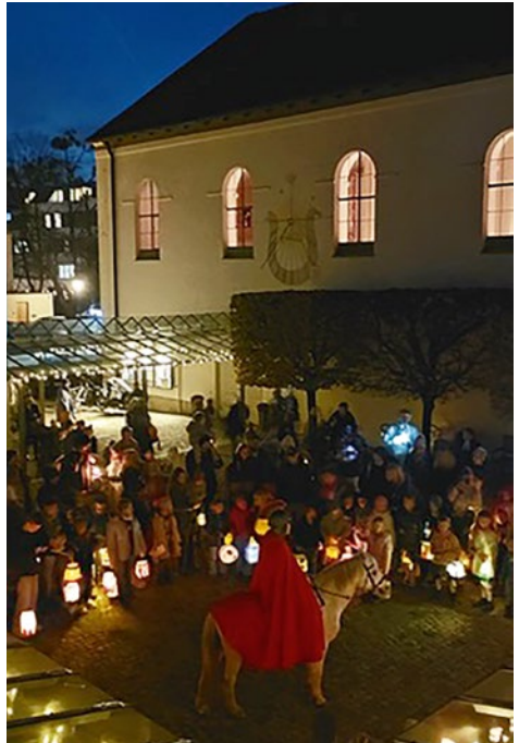
Ökumenischer St. Martinsumzug