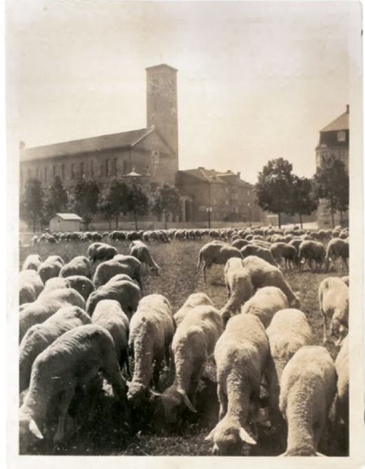
Der Kirchenneubau von St. Gabriel stand 1926 noch auf einer grünen Wiese

Bei einem Bombenangriff am 13. Juni 1944, dem Antoniustag, traf eine Sprengbombe unsere Kirche. Das Sakristeigebäude mit Mesnerwohnung wurde zerstört. In die Wand des Presbyteriums wurde ein großes Loch gerissen. Die Nazi-Behörden verboten, die große Kuppel, die das Presbyterium überwölbte, abzustützen. Das Baumaterial wurde ja für kriegswichtige Zwecke benötigt. So stürzte die Kuppel am 4. Oktober 1944, dem Franziskusfest, herunter und schlug bis in den heutigen Pfarrsaal durch. Die Kirche wurde gesperrt, eine provisorische Wand aus Schallbrettern errichtet, damit wieder Gottesdienste gefeiert werden konnten.