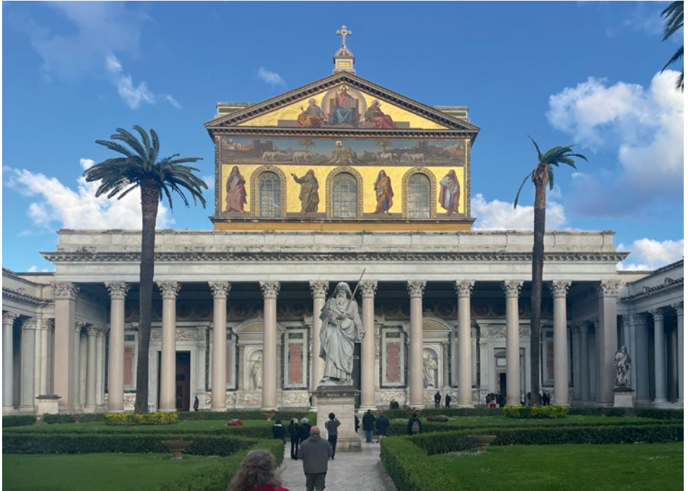
Basilica Papale Di San Paolo Fuori le Mura