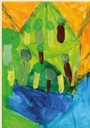
Cosima – nach „Kleine rhythmische Landschaft“ von Paul Klee