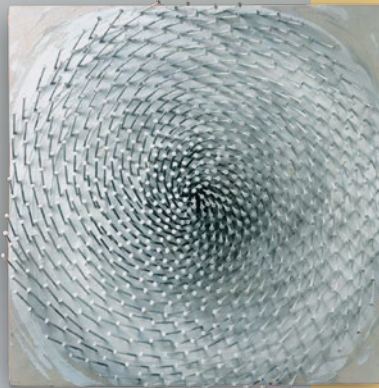
Günther Uecker, Spirale, 1994, Nägel, Holz und Farbe, 60 x 60 cm, Privatsammlung