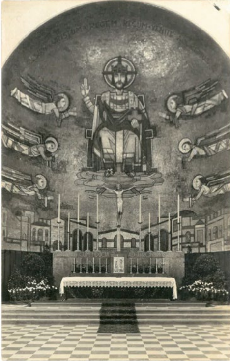
Das Mosaik in der Apsis, das im Zweiten Weltkrieg zerstört wurde