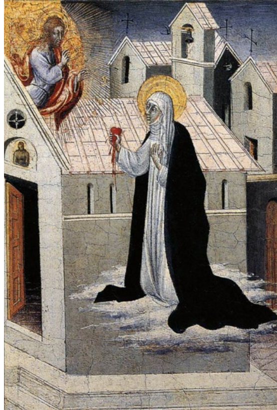
Giovanni di Paolo, di mystische Vermählung. Katharina tauscht ihr Herz mit dem von Christus

Spiritualität bedeutet nicht Rückzug, sondern Engagement für andere. In einer Welt, die oft von Egoismus geprägt ist, ist ihr Beispiel aktueller denn je. Ihr Leben zeigt, dass man sich einmischen darf und soll, wenn