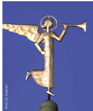
Der Erzengel Gabriel auf dem Kirchturm

P.S. Die Frage, warum der Hase so eng mit Ostern verbunden ist, beantworten wir auf Seite 20.