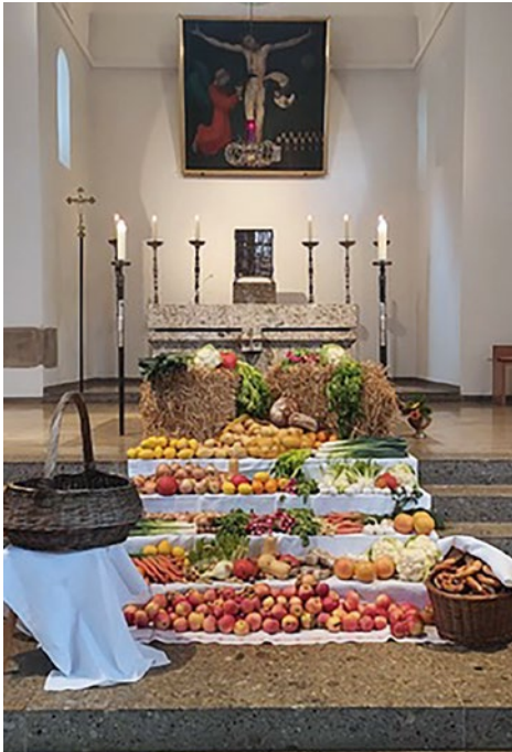
Erntedank in Heilig Blut