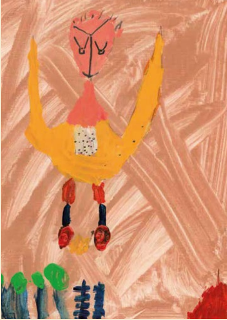
Nikolaus – nach „Angelus descendus“ von Paul Klee