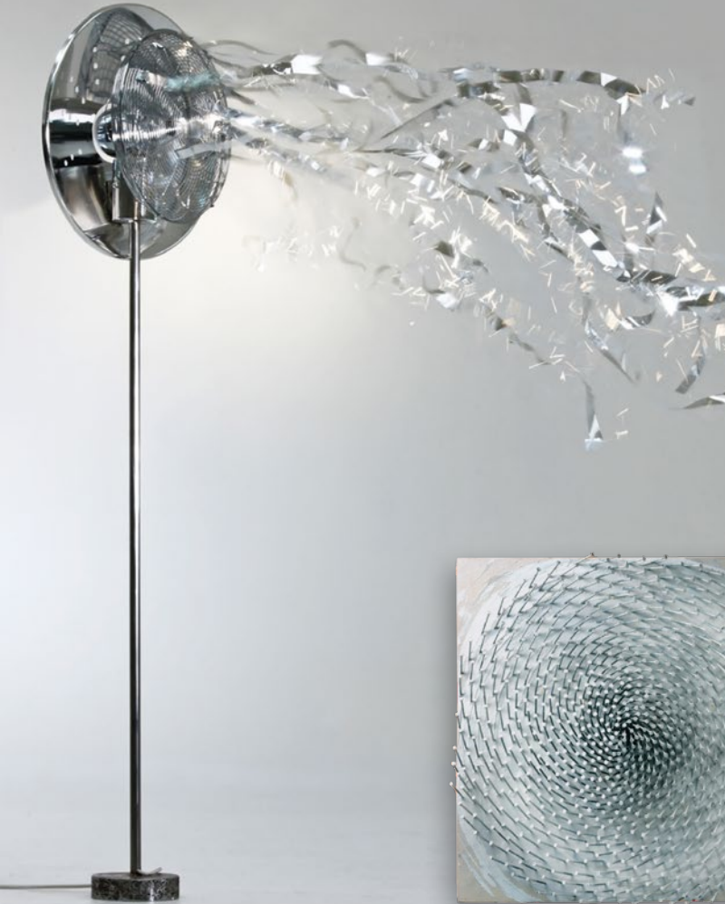
Heinz Mack, Siehst du den Wind? (Gruß an Tinguely), 1962, mkp.ZERO.2008.16, ZERO foundation, Düsseldorf Donation Heinz Mack