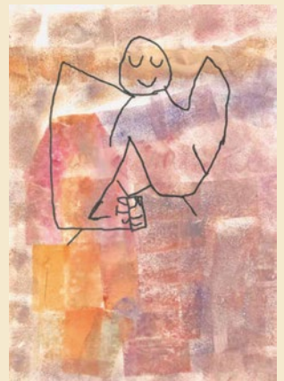
Otto – nach „Der vergessliche Engel“ von Paul Klee