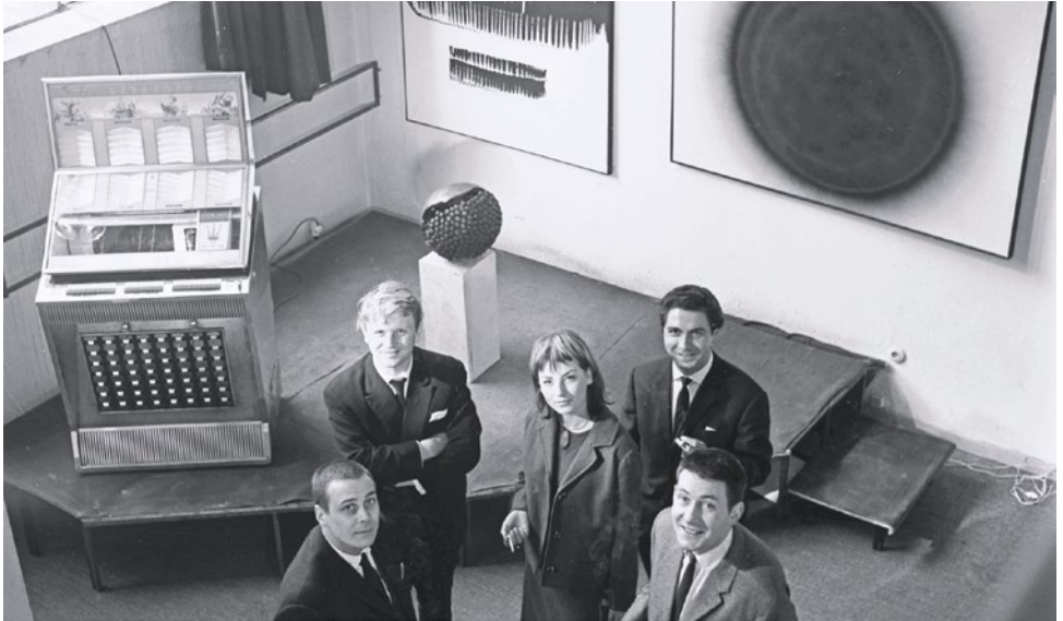
Heinz Mack, Otto Piene, Günther Uecker und ihre Freunde

Im Olaf Gulbransson Museum Tegernsee wird die Ausstellung ZERO – Zero, das ist die Kunst am Nullpunkt gezeigt. Das ist der Name, mit dem sich eine lose Gruppe von Künstlerinnen und Künstlern der Jahrgänge 1925–1935 bezeichnet, die nach dem Zweiten Weltkrieg die Kunst erneuern wollten. Sie experimentierten mit neuen