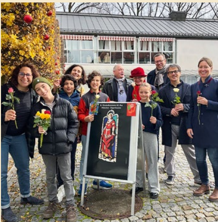
Der 16. November ist Elisabethentag. Jeder Gast erhält eine Rose.