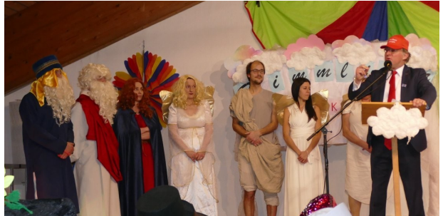
Programmpunkt „himmlischer Wahlkampf“ beim Kappenabend

die Akteure der Kolpingsfamilie freuen sich sehr, den vielen Besuchern fröhliche Abende geboten zu haben. Wir sind stolz, bei der Jahreshauptversammlung von den Spendeneinnahmen an den Kappenabenden je 1.500,00 Euro an die Anna-Hospiz-Insel und an die katholischen Kindergärten übergeben zu können.