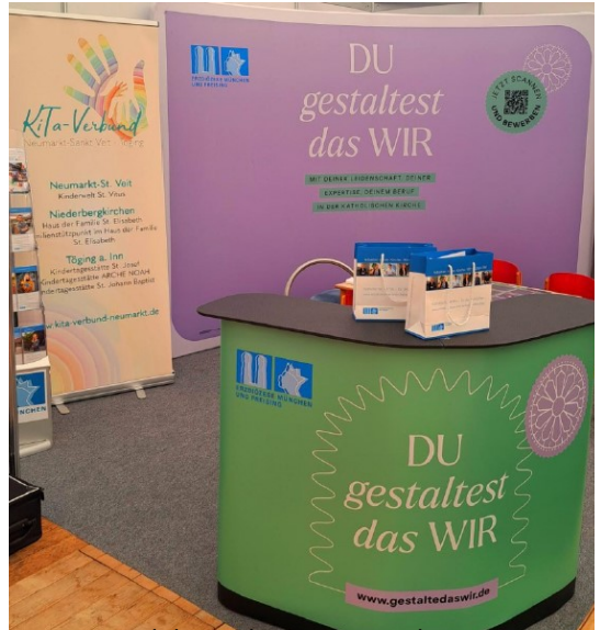
Messestand des Erzbistums München-Freising