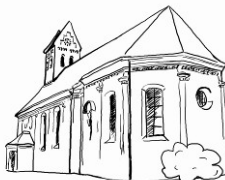
St. Peter und Paul