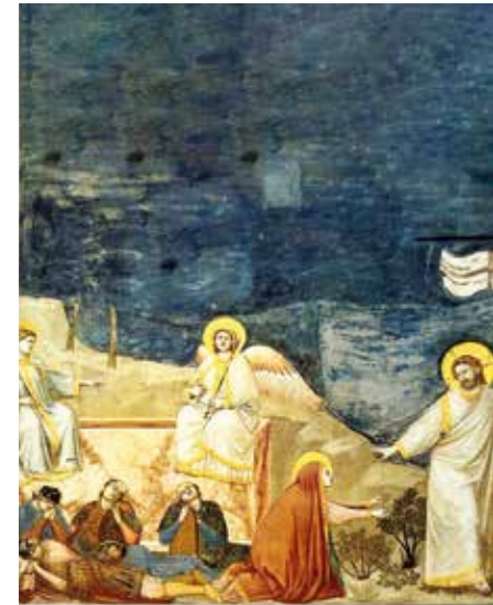
„Noli me tangere“ – eine Ostergeschichte im Bild

Auch Maria trägt einen irdisch- braunen Umhang, allerdings vom überirdischen Licht erhellt und mit einem goldfarbenen Saum; um ihr Haupt der Nimbus- der Heiligenschein. Sie streckt ihre Hände nach Jesus aus, der im Begriff ist, das Bild zu verlassen. Auch er ist weißgewandet. In einer Hand trägt er die Siegesfahne als Zeichen des Sieges über den Tod. An Hand und Fuß sind noch die Wundmale zu sehen, als Beweis, dass es wirklich der Herr ist, der durch Passion und Tod gegangen ist. Auch der Nimbus hat das Kreuzzeichen, ein Attribut, das nur zu Jesus gehört. Nachsichtig wehrt er Maria ab- Halte mich nicht fest, sagt uns die Szene. – Noli me tangere