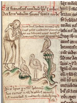
Chronica maiora: Die Vogelpredigt des Franz von Assisi (Cambridge, Corpus Christi College, MS 16 II, fol. 70v), ca. 1250