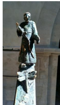
„Der heilige Franziskus und die Tiere“, Treppenhandlauf aus Bronze, Heinrich Apel, 1972, Dom zu Naumburg/Saale