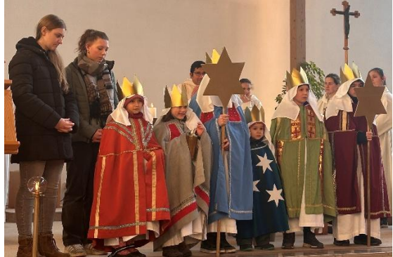
Sternsinger in Neufahrn