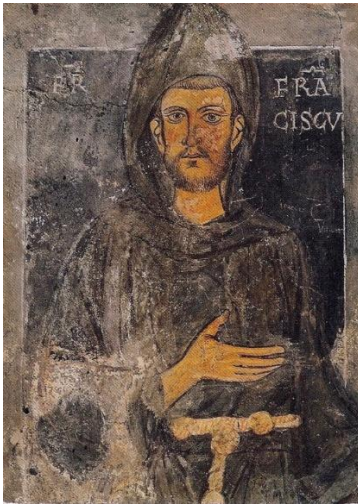
Oberer Ausschnitt des ältesten Portraits des Franz von Assisi, Wandgemälde, Kloster Sacro Speco in Subiaco, ca. 1226-1228