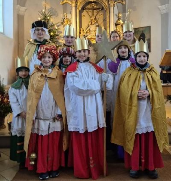
Sternsinger in Mintraching