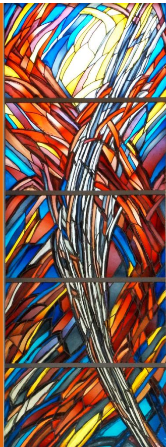
„Die Auferstehung“ - Glaskunst v. Prof. Bischof - Pfarre: Gmunden-Ort - Diözese Linz