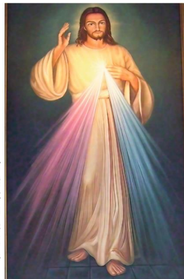
Gnadenbild vom barmherzigen Jesus

Der Barmherzigkeitssonntag (auch Sonntag der Göttlichen Barmherzigkeit) ist der erste Sonntag nach Ostern und wurde 2000 von Papst Johannes Paul II. eingeführt, basierend auf den Visionen der Heiligen Faustina Kowalska, um die unerschöpfliche göttliche Barmherzigkeit zu feiern. Dieser Tag lädt ein, das Bild des Barmherzigen Jesus zu verehren.