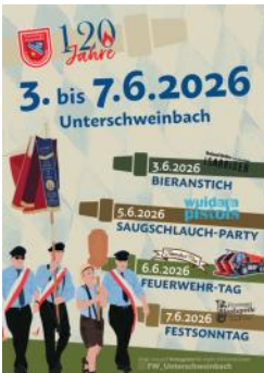
Plakat: FFW Unterschweinbach