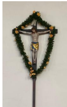
Günzlhofener Andechskreuz

Die Rückkehr ist für Donnerstag, 14. Mai, gegen 15:00 Uhr geplant. Nach der kleinen Andacht zur Begrüßung in Günzlhofen laden wir im Pfarrhof zu kühlen Getränken ein.