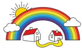
Nachbarschaftshilfe Wörth/Hörlkofen e.V.

E-Mail: info@nachbarschaftshilfe-woerth.de