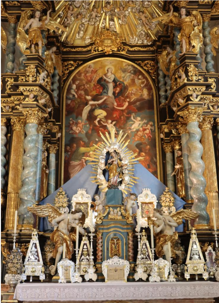
Hochaltar in der Wallfahrtskirche Mariä Himmelfahrt

St. Michael - Peiting Auferstehung des Herrn - Hohenpeißenberg