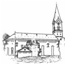
St. Nikolaus (St.N.)