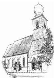
St. Andreas (St.A.)