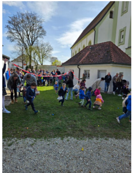
Text und Fotos: Karoline Hupfer Logo Kinderkirche: Johanna Thalmaier Logo Familiengottesdienst: Susanne Knittler