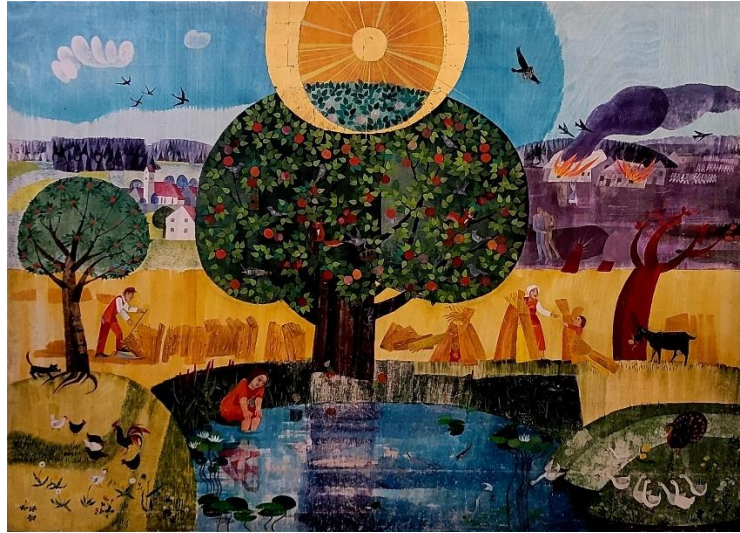
Original-Gemälde von Marle Reidl