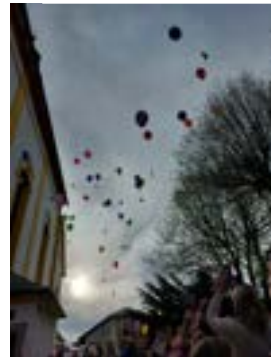
Luftballone mit den Dankesworten der Erstkommunionkinder steigen in den Himmel.