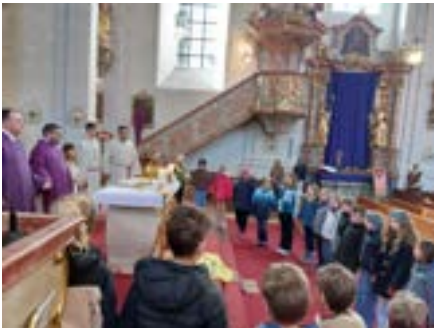
Vater unser Kreis beim Gottesdienst am 5. Fastensonntag.