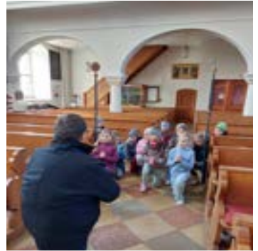
Bei der Kirchenführung wird die Kniebeuge geübt.

Jesus ist so ein Freund für uns alle. Dies durften die Kinder in der Vorbereitungszeit auf ihre Erstkommunion erfahren und erleben.