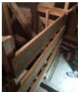
Neues Geländer: Kirchturmaufgang in der Pfarrkirche

Fehlende Absturzsicherungen und Geländer in den Kirchenschiffdachböden und in den Aufgängen zu den Kirch- bzw. Glockentürmen wurden in der Pfarrkirche und in der Filialkirche St. Vinzenz angebracht. Im Mai erfolgen die Maßnahmen in der Frauenkirche.