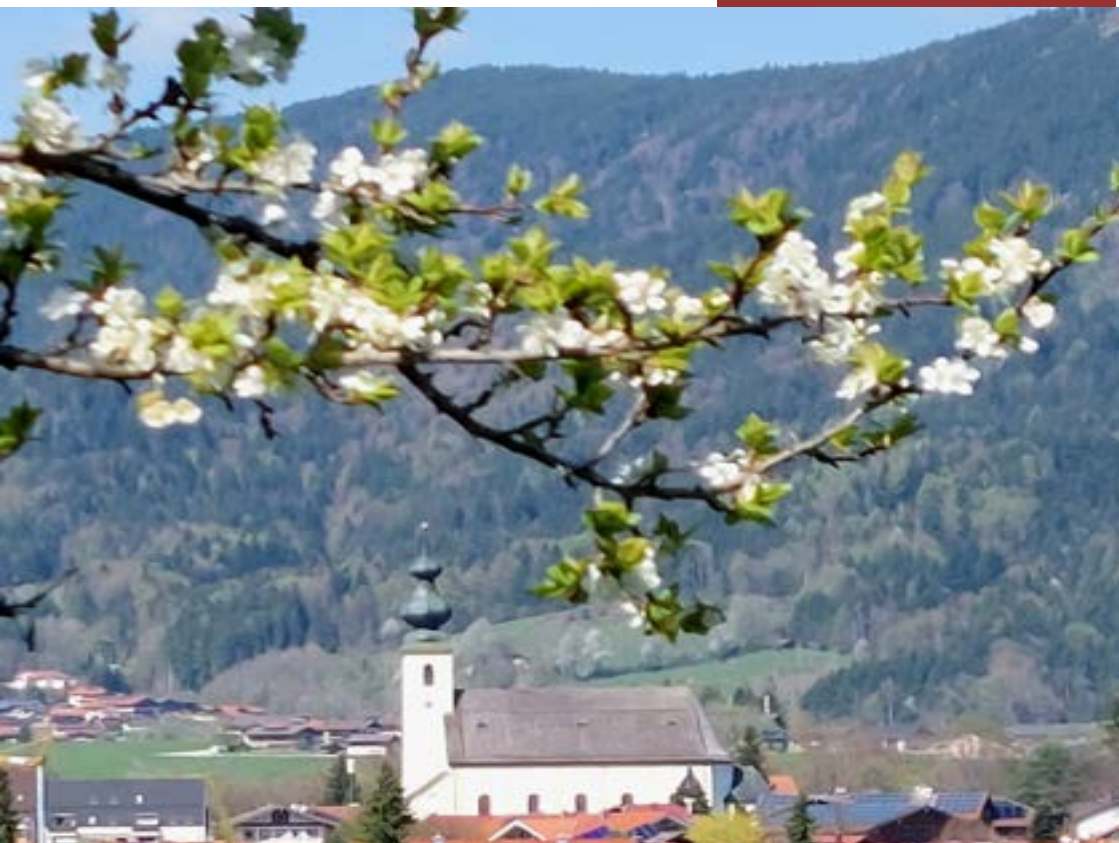
Pfarrkirche St. Michael

Wir können den Wind nicht ändern, aber die Segel anders setzen.