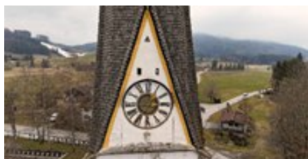
Sanierungsbedürftige Stellen des Turms

Die geplante Fassadensanierung des Turmes an der Frauenkirche soll 2026 durchgeführt werden. Die Baugenehmigung seitens des Ordinariats liegt vor, als auch der Erlaubnisantrag der unteren Denkmal-schutzbehörde. Die Kosten der Sanierung sind von der Kirchenstiftung zu tragen.