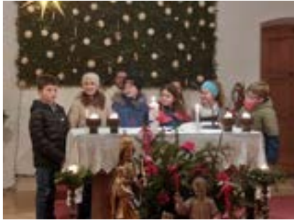
Die Weißbacher Erstkommunionkinder stellen sich beim Lichtmessen-gottesdienst vor.

So lautete das Motto der diesjährigen Erstkommunion, die am 26.04.2025 in Inzell 27 Kinder und am 10.05.2026 in Weißbach 6 Kinder feierten. Ein Freund ist jemand, der mich gerne hat. Mit einem Freund kann ich Spaß haben und zusammen lachen. Ein Freund steht treu zu mir, besonders wenn