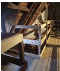
Geländer: Kirchenschiffdachboden St. Vinzenz in Weißbach