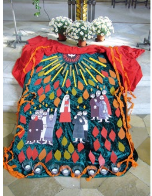
Pfingstbild von Kindern vor dem Altar von St. Margaret

Nach einer Ausbildung zur Erzieherin habe ich in meiner Heimat Osnabrück katholische Theologie studiert. Meine Wege haben mich danach zunächst in die Schulpastoral im Bistum Fulda und anschließend in die Erzdiözese München und Freising, genauer nach St. Matthias Waldram geführt. Dort habe ich die Schul- und Berufungspastoral verantwortet und eine Wohngruppe mit jungen Erwachsenen