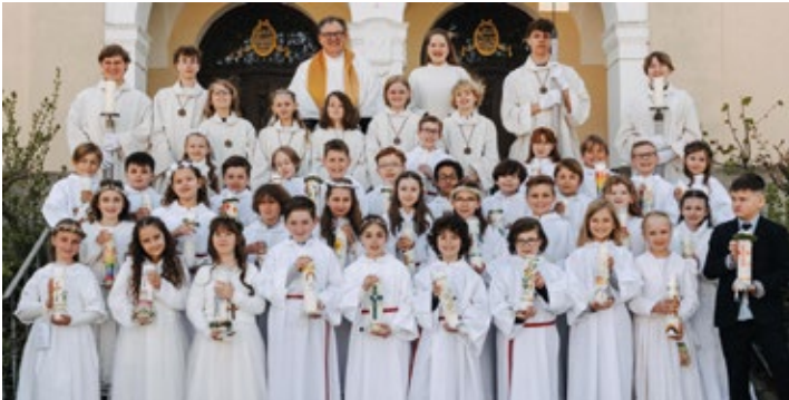
Kommunion der Achdorfer Kinder am Samstag 25.04.2026