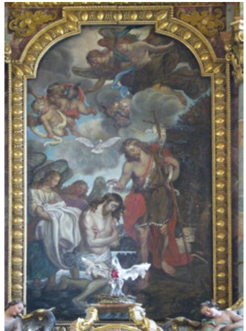
Der Hochaltar in Hoheneggkofen