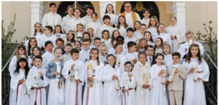
Kommunion der Kinder des Altpfarrverbandes am Sonntag 26.04.2026