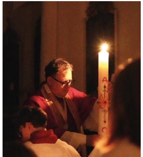
Lumen Christi in der dunklen Kirche