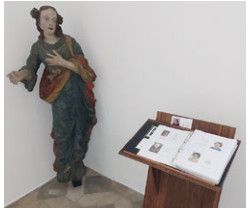
Maria Magdalena und der Ordner mit den Sterbebildern in St. Margaret