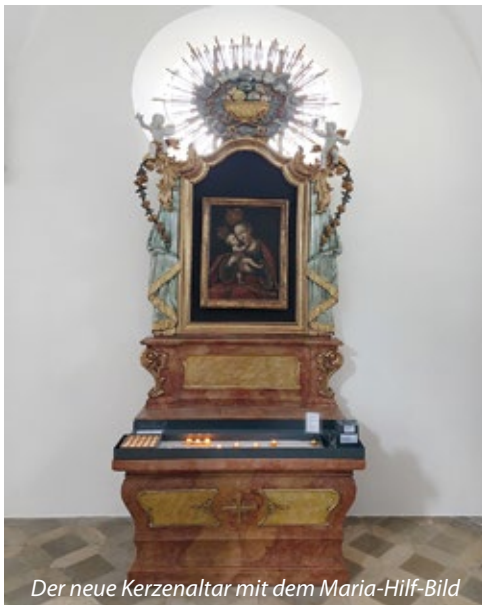
Der neue Kerzenaltar mit dem Maria-Hilf-Bild

Seit einigen Wochen gibt es auch in St. Margaret wieder die Möglichkeit, Opferlichter aufzustellen: am Maria-Hilf-Altar im rechten Seitenschiff.