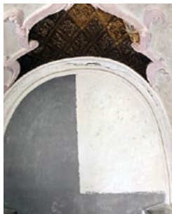
Foto links: Schadhafte Stuck an der Kirchenkuppel, Foto rechts: Beispiel für den Grad der Verschmutzung

Unser wintertaugliches Pagodenzelt hat sich auch im vergangenen Winter bewährt, obwohl der Winter lang und kalt gewesen ist. Aktuell planen wir auch weiterhin alle Gottesdienste im Freien am Friedhof. Ein besonderer Dank gilt nach wie vor allen Beteiligten, die zum Gelingen der Gottesdienste im Freien beitragen.