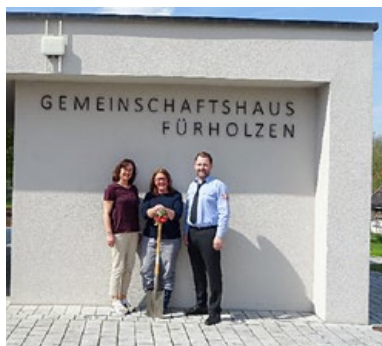
Auf dem Bild links: Die Schauspieler der Dorfbühne Günzenhausen

Bericht: Priska Kreitmeier, Fotos: Armin Nefzger