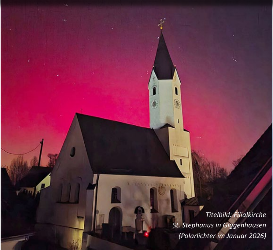
Titelbild: Filialkirche St. Stephanus in Giggerhausen (Polarlichter im Januar 2026)

Deutenhausen, Fürholzen, Gesseltshausen, Giggerhausen, Gremertshausen Günzenhausen, Hetzenhausen, Massenhausen, Sünzhausen