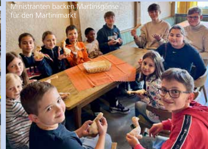
Ministranten backen Martinsgänse für den Martinimarkt