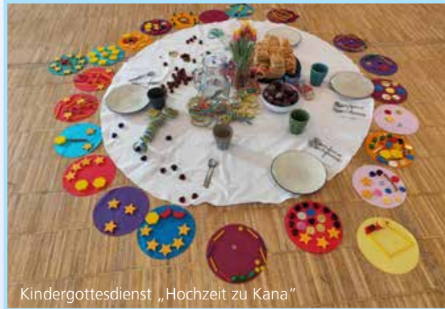
Kindergottesdienst „Hochzeit zu Kana“