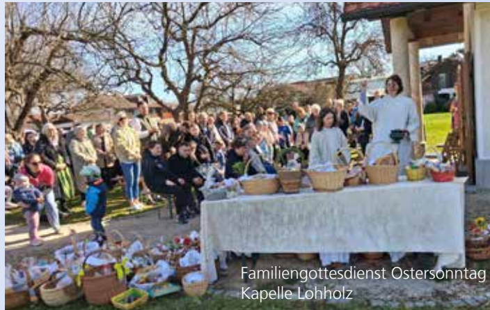
Familiengottesdienst Ostersonntag Kapelle Lohholz