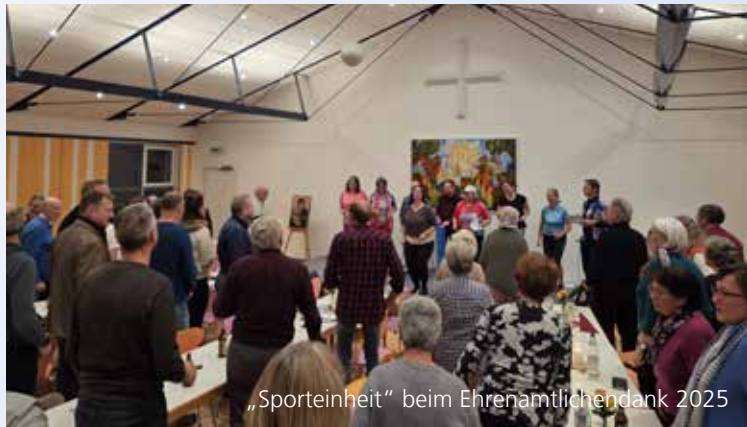
„Sporteinheit“ beim Ehrenamtlichendank 2025