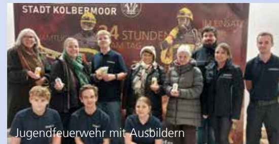
Jugendfeuerwehr mit Ausbildern

Letztes Jahr wurden die Erlöse aus dem Osterkerzenverkauf an Zeltlager Kohlstatt, Sonnenstern e.V. und an die Jugendfeuerwehr verteilt. Die Jugendlichen mit ihren Ausbildern haben sich sehr gefreut.