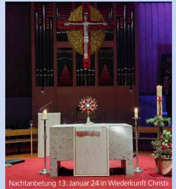
Nachtanbetung 13. Januar 24 in Wiederkunft Christi