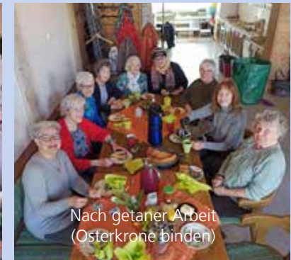
Nach getaner Arbeit (Osterkronen binden)