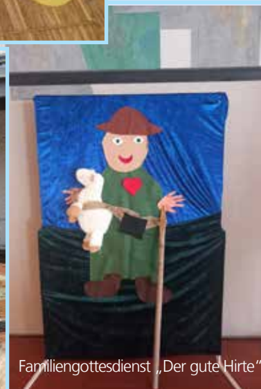
Familiengottesdienst „Der gute Hirte“