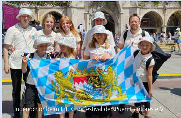
Jugendchor beim Int. Chorfestival der Pueri Cantores e.V.