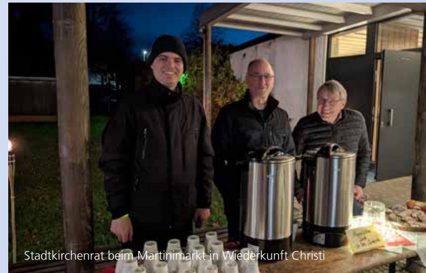
Stadtkirchenrat beim Martinimarkt in Wiederkunft Christi