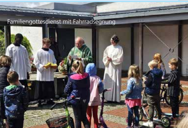
Familiengottesdienst mit Fahrradsegnung