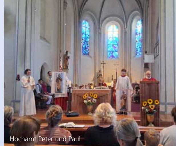
Hochamt Peter und Paul