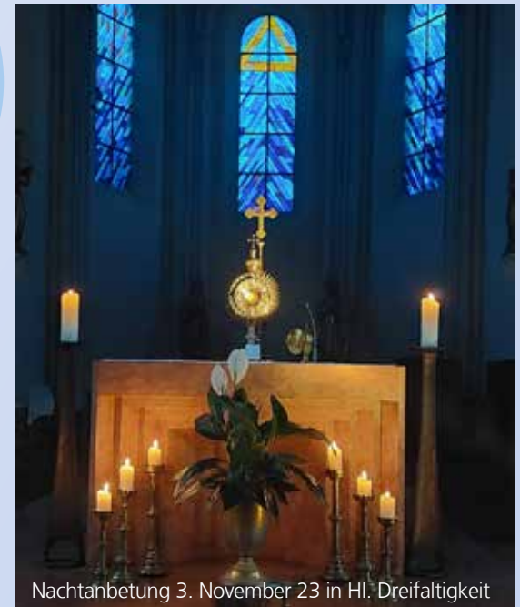
Nachtanbetung 3. November 23 in Hl. Dreifaltigkeit