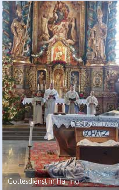
Gottesdienst in Halfing

Ein großes Highlight war der Jahresauftakt in Halfing. Nach einer eindrucksvollen Kirchenführung durften wir mit dem neuen Priester in Halfing die Hl. Messe feiern, sogar mit Orgelspiel.