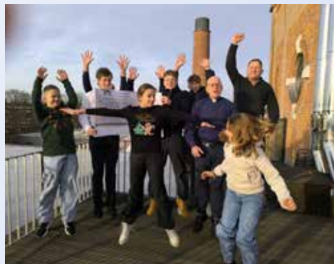
Firma BayFu GmbH Spendenübergabe