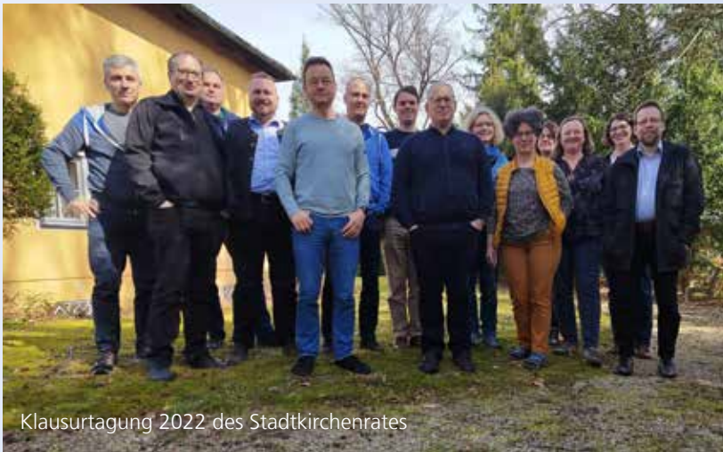
Klausurtagung 2022 des Stadtkirchenrates