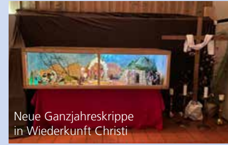
Neue Ganzjahreskrippe in Wiederkunft Christi