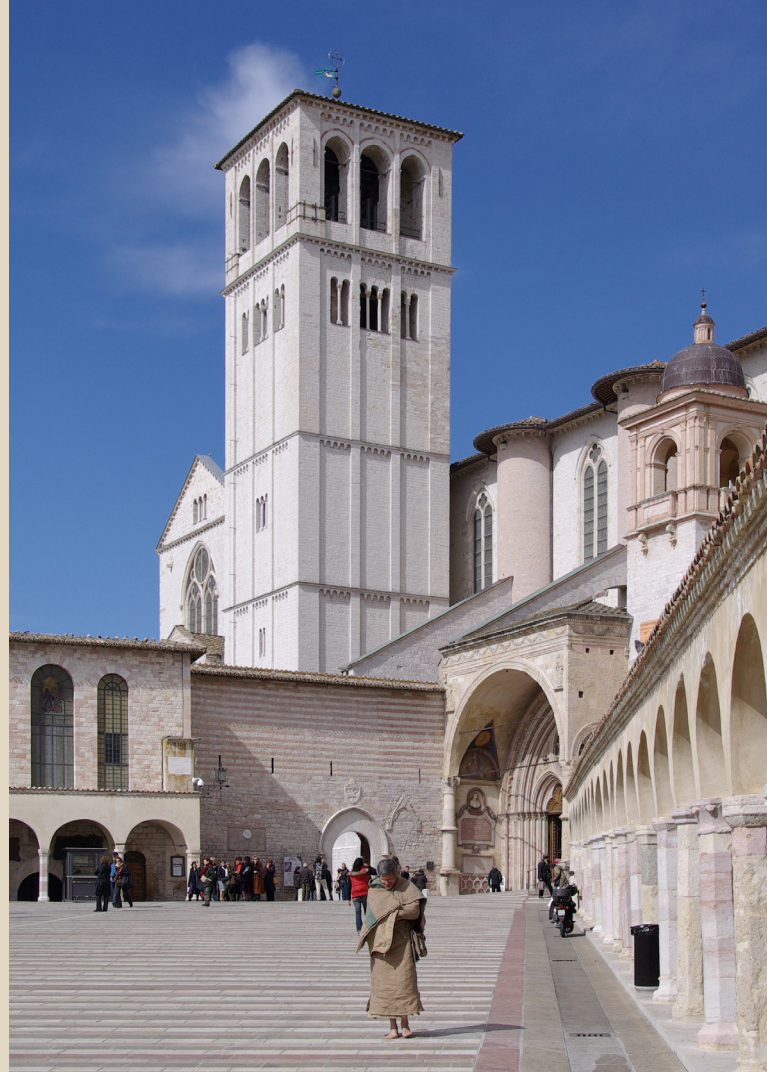
Assisi

terra, da parte mia, questa indulgenza”. Francesco si presentò subito al pontefice Onorio III, che lo ascoltò con attenzione e diede la sua approvazione. Alla domanda: “Francesco, per quanti anni vuoi questa indulgenza?”, il santo rispose: “Padre santo, non domando anni, ma anime”. E, felice, il 2 agosto 1216, insieme ai vescovi dell'Umbria, annunciò al popolo convenuto alla Porziuncola: “Fratelli miei, voglio mandarvi tutti in Paradiso!”».