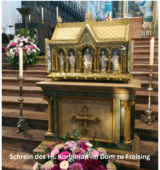
Schrein des Hl. Korbinian im Dom zu Freising