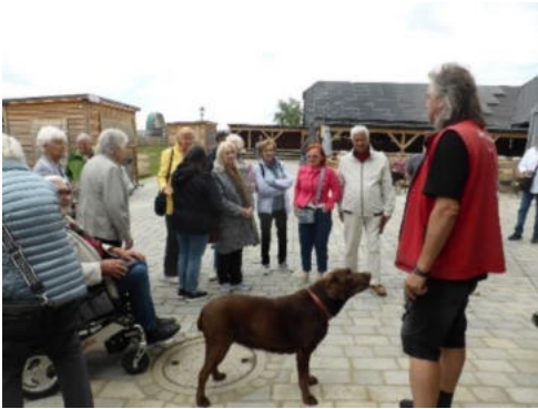
Text und Fotos: Christa Graßl/Gut Aiderbichl