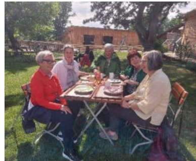
Text und Fotos: Michelle Schwädt

„Wer grausam gegen Tiere ist, kann kein guter Mensch sein.“ (A. Schopenhauer)