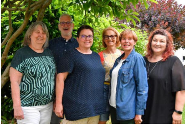
Hans Rummel fehlt auf dem Bild

Der Pfarrverbandsrat ist das zentrale Gremium der Laien in einem katholischen Pfarrverband. Er koordiniert die pastorale Arbeit, berät das Seelsorgeteam und übernimmt Aufgaben, die für die Pfarreien einheitlich geregelt und aufeinander abgestimmt werden müssen.